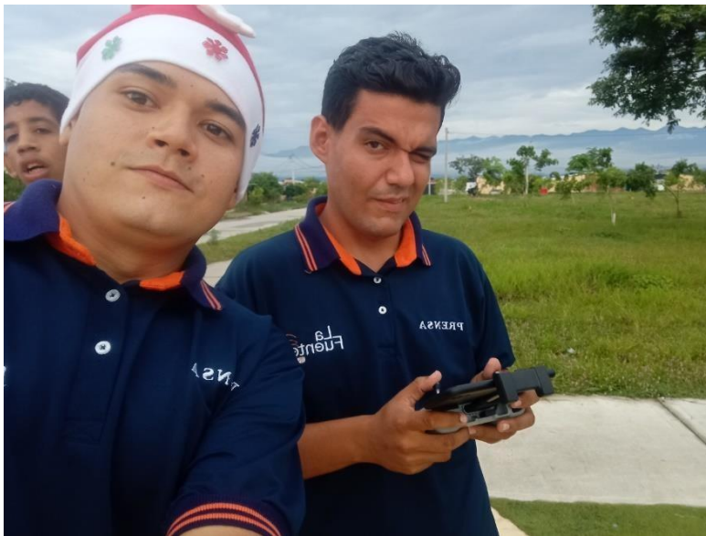
Figura 8. Evidencia de la pasantía