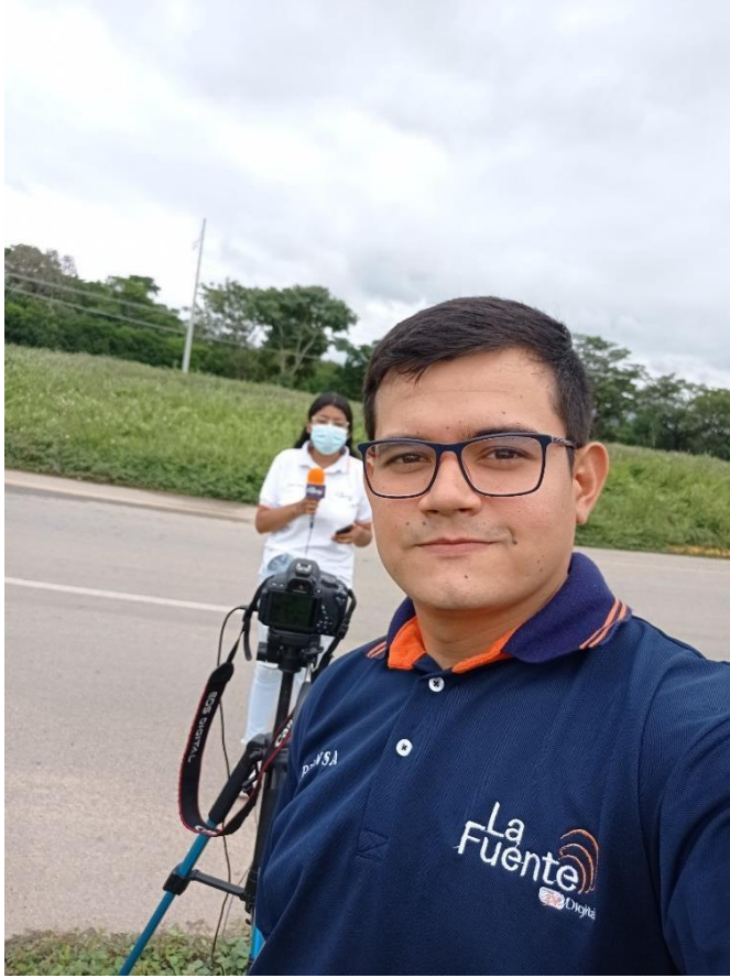
Figura 4. Evidencia de la pasantía