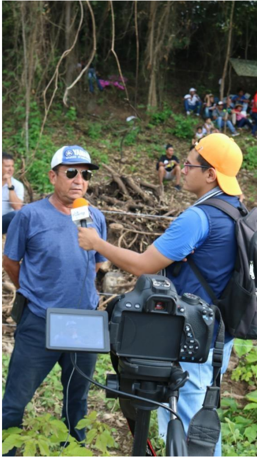
Figura 1. Evidencia de la pasantía