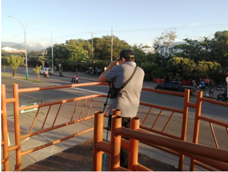
Figura 14. Evidencia de la pasantía