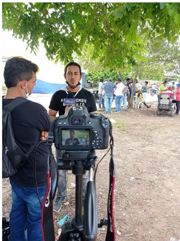
Figura 1. Evidencia de la pasantía