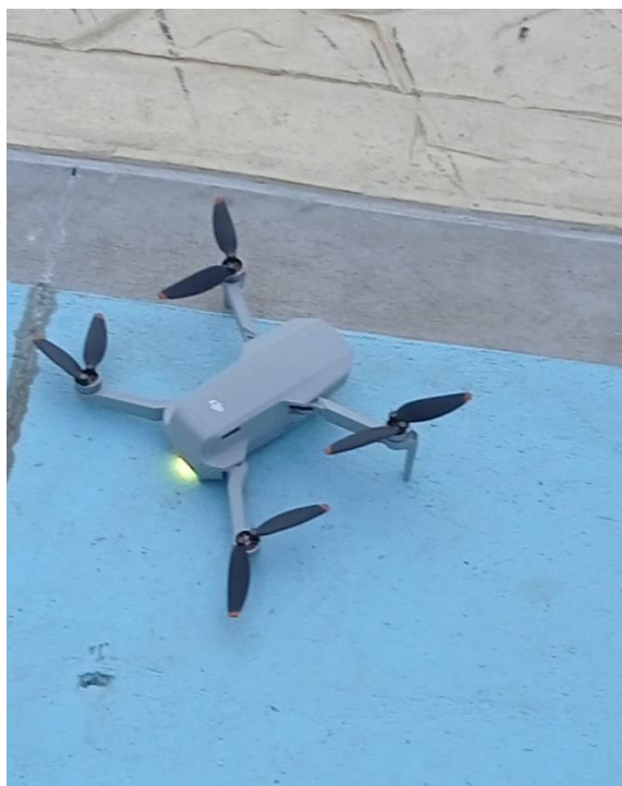
Figura 9. Evidencia de la pasantía