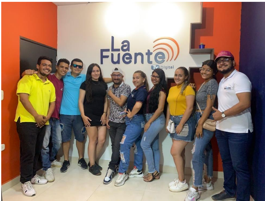
Figura 1. Evidencia de la pasantía