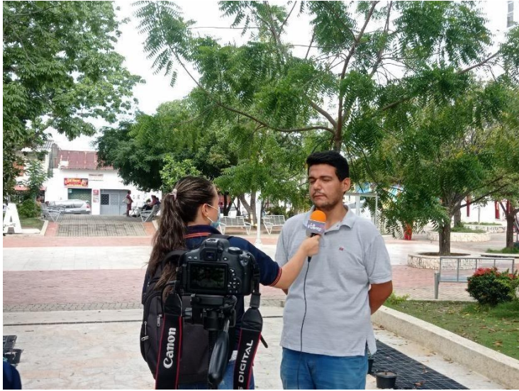
Figura 7. Evidencia de la pasantía