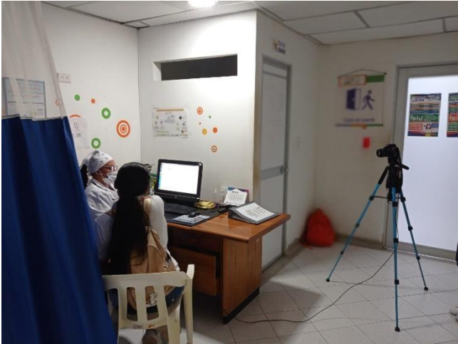
Figura 2. Evidencia de la pasantía