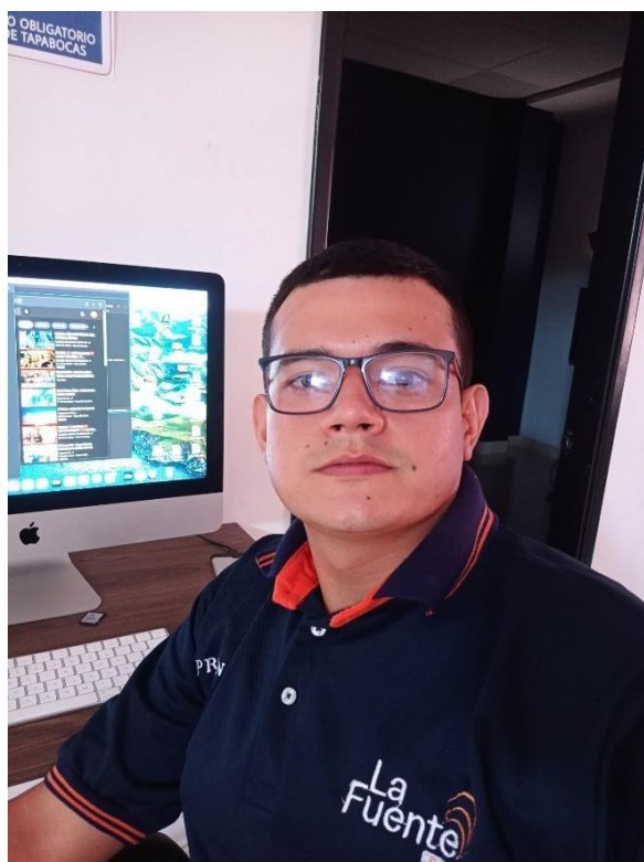
Figura 10. Evidencia de la pasantía