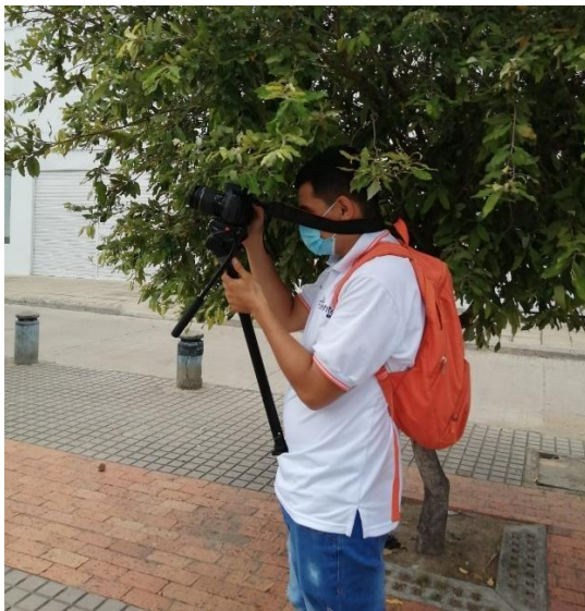
Figura 13. Evidencia de la pasantía