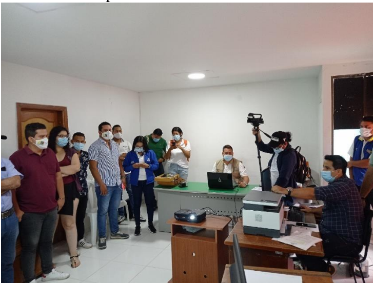
Figura 3. Evidencia de la pasantía