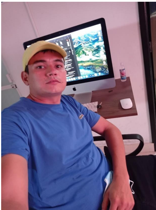
Figura 6. Evidencia de la pasantía