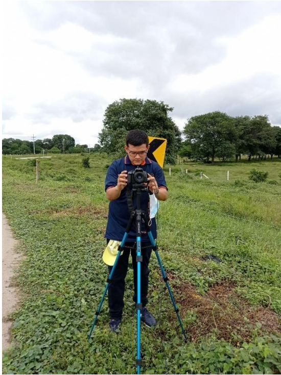
Figura 5. Evidencia de la pasantía