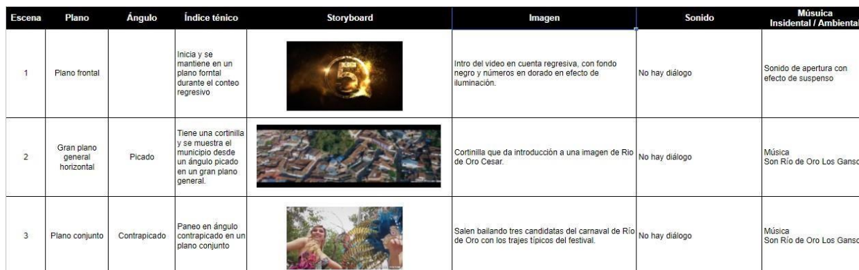
Figura 10. Elaboración del Storyboard

Luego de recopilar el material a trabajar se plasmaron las ideas del orden en como irá plasmado el documental, teniendo en cuenta el orden cronológico que se debe implementar, se plasmó el Storyboard y el guion técnico donde se elaboró en Excel secuencia por secuencia que se utilizaría como guion en la elaboración del documental.