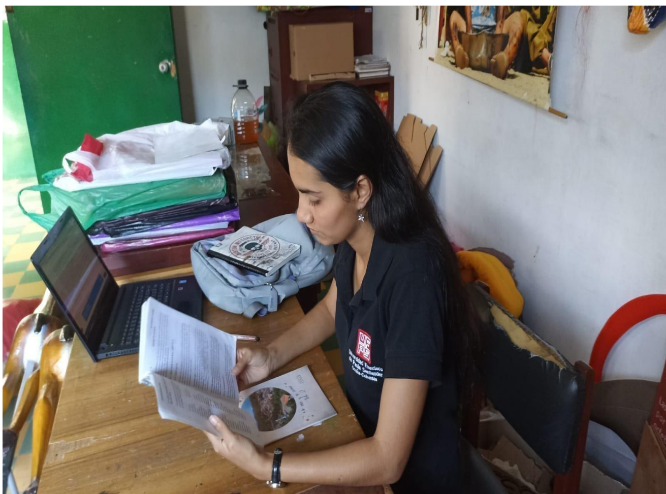
Figura 3. Investigación en libros del CEAC

Después de recopilar la información pertinente se realizó una clasificación del material necesario, para dar cumplimiento a la ejecución de las actividades, la clasificación se realizó en orden cronológico desde los inicios hasta la presente.