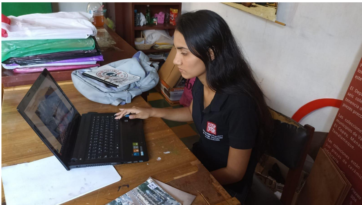
Figura 2. Trabajo realizado en el CEAD

Los medios como Facebook, Instagram, YouTube, libros, videos, entrevistas, materia de apoyo fueron la pieza fundamental para el inicio de las actividades planteadas en el proyecto.