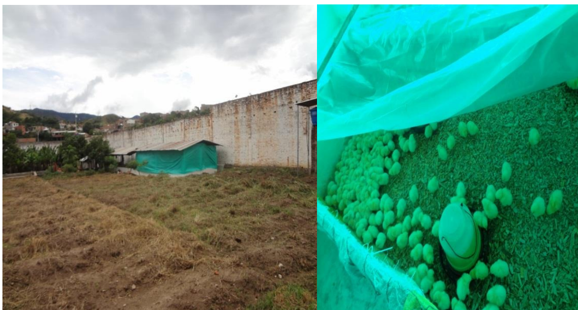
Foto 3. Galpón de Aves