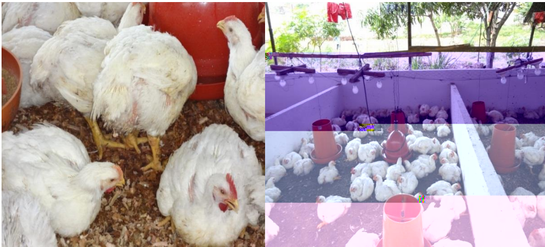
Foto 2. Primer lote de aves 35 días.