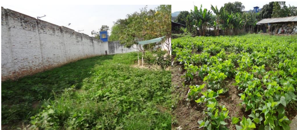
Foto 4. Cultivo de Frijol.