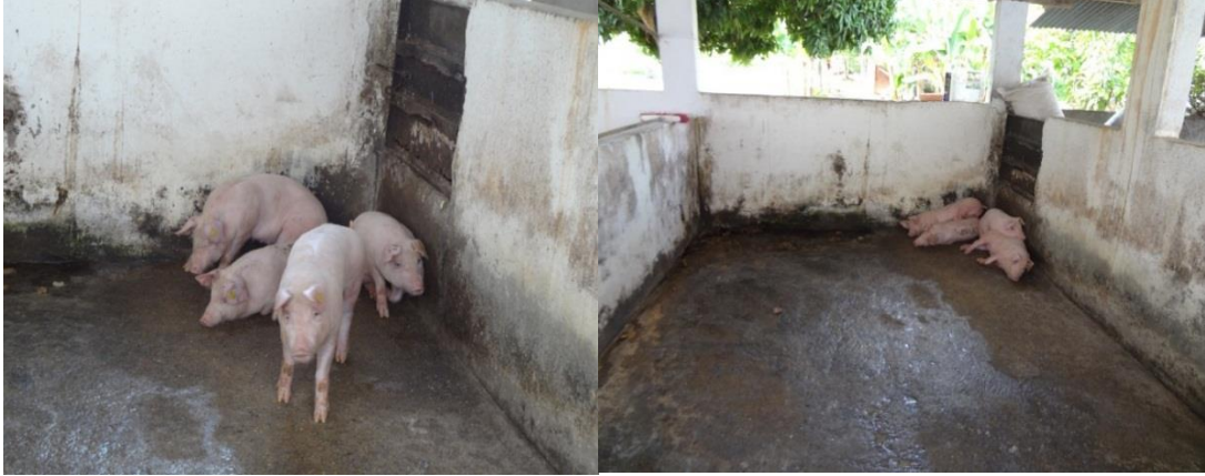
Foto 1. Primer Lote de Cerdos de 4Meses.