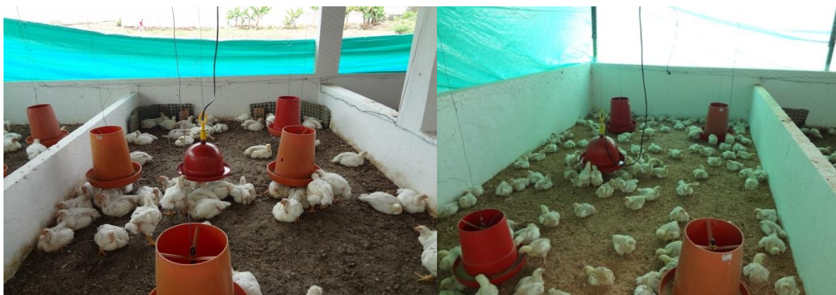
Foto 7. Primer lote de aves a 25 días.