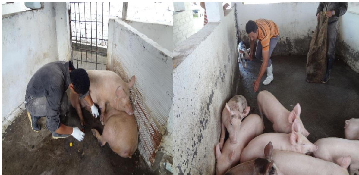
Foto 8. Sanidad y pesaje en la explotación porcina.