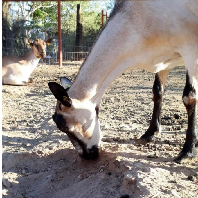
Fotografía 5. Deficiencia de minerales