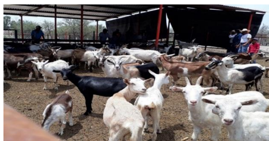
Fotografía 2. Inventario caprino Fuente: Autor del informe

La granja Don Luis y Don Laco cuentan con mejor genética, las razas sobresalientes en estas explotaciones son la alpina, toggenburg y saanen. Mientras que en la granja Don Martín, se carece de selección genética ya que el productor acostumbraba a dejar todas las hembras que nacían para pie de cría sin importar sus características morfológicas, por otra parte los machos eran vendidos para sacrificio.