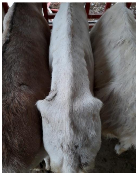
Fotografía 7. Condición corporal de algunas cabras

La granja Don Martín presentaba un gran número de cabras con condición corporal baja como se muestra en la fotografía 7, esto se debe a los factores anteriormente mencionados que generan problemas de salud en los animales, haciendo que la productividad no sea la adecuada.