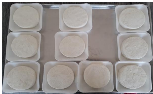
Fotografía 10. Queso panela (fresco)