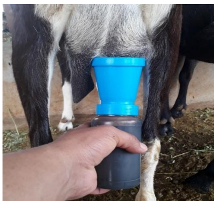
Fotografía 8. Sellado de pezones

Para optimizar la productividad de los hatos se estableció en las cuatro explotaciones un horario de ordeña fijo, ya que los animales se acostumbran a este, al alimento, música y sonidos que se generen durante el ordeño. Se aplicó la norma de buenas prácticas de ordeño para un buen manejo durante el proceso, iniciando por el lavado y secado de ubre, presellado y sellado de los pezones (fotografía 8), clasificación de los equipos exclusivamente para el ordeño (fotografía 9).