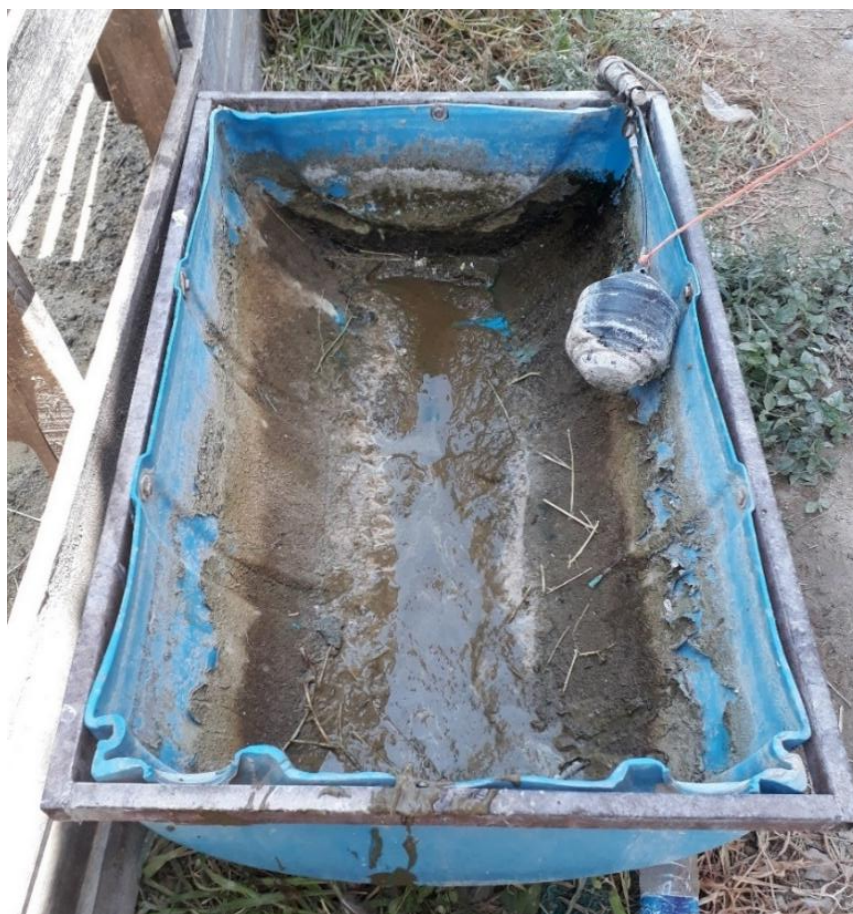
Fotografía 3. Bebedero granja Don Laco

Nota: La tabla muestra el número de animales en sus diferentes fases que tenían las cuatro granjas. Fuente: Autor del informe