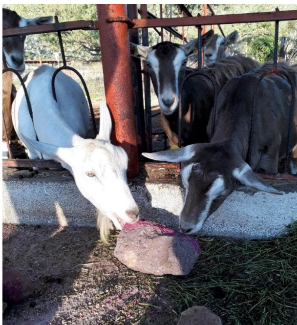
Fotografía 16. Implementación de sales minerales