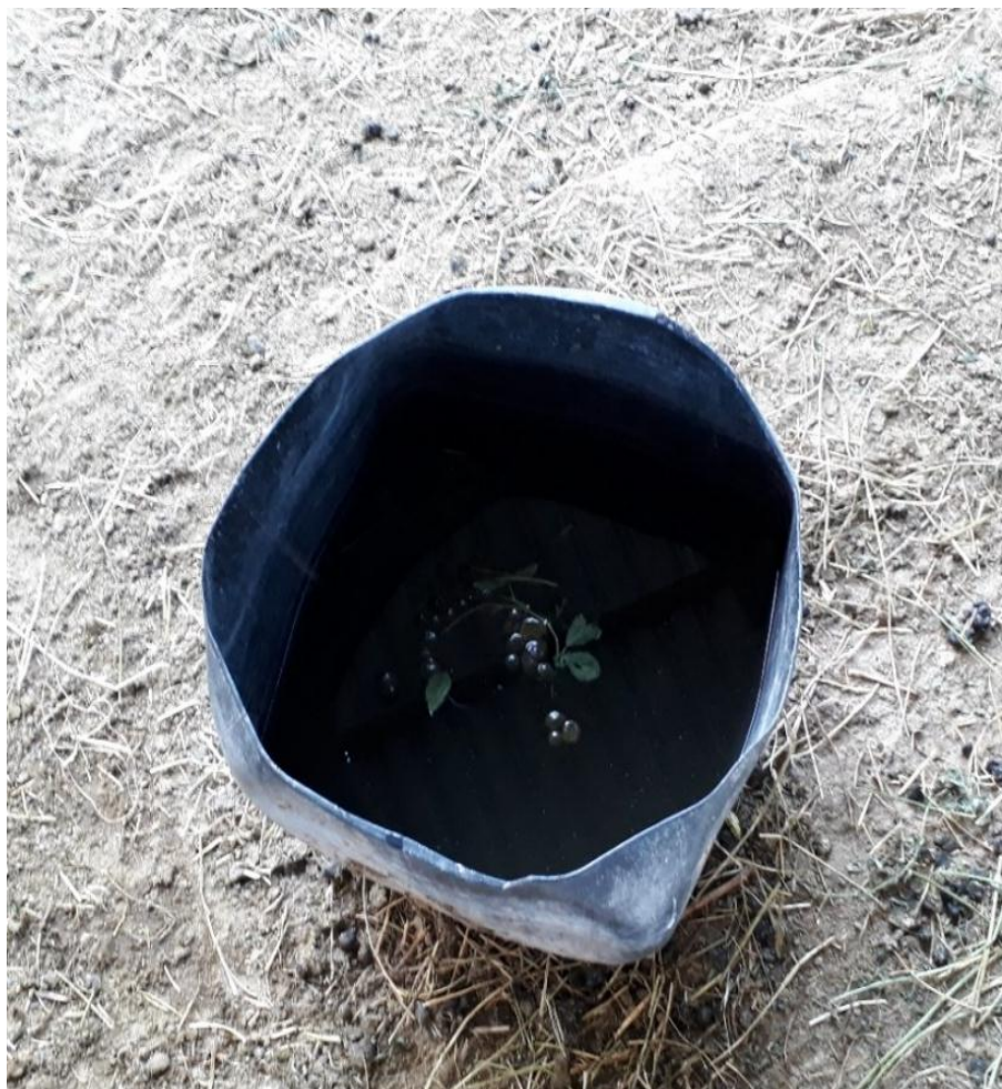
Fotografía 4. Bebedero granja Don Luis