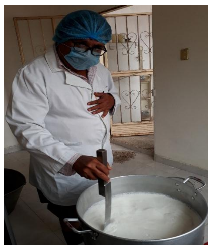
Fotografía 11. Productores aplicando normas de bioseguridad

Antes de brindar el alimento fabricado dentro de la granja, el rendimiento obtenido en la producción de queso era del 9% y después que se suministró en la dieta de los animales aumentó en un 2 %. Inicialmente de 22 kg de leche procesada se extraían 1980 gramos de queso para la venta y después que se cambió el tipo de ración se aumentó el rendimiento hasta un 11% de producto terminado y esto en gramos representaba de 2420 gramos lo que nos indica que la ración mejoró los sólidos totales de la leche, esta diferencia representa mayores ganancias para el productor.