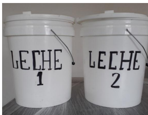
Fotografía 9. Equipos de ordeño