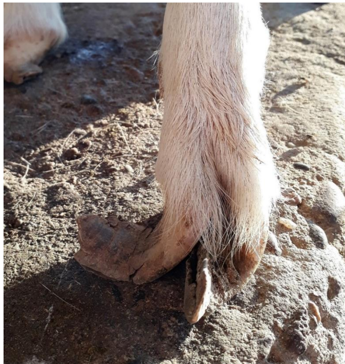
Fotografía 6. Deterioro de pezuñas