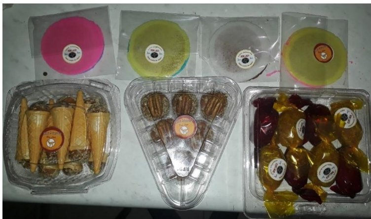
Fotografía 13. Glorias