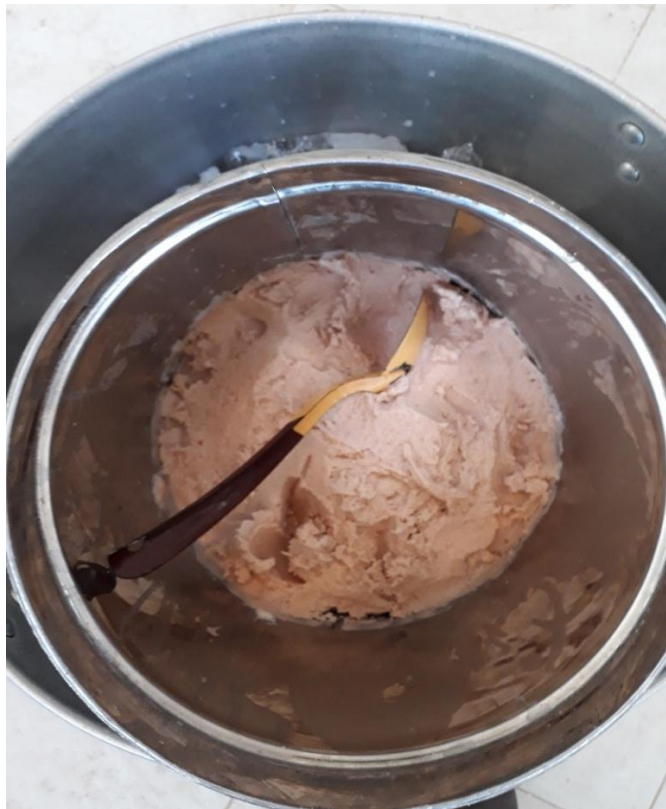
Fotografía 12. Nieve de garrafa

Gracias a una visita realizada a la Universidad Autónoma de Chapingo, aprendí a fabricar un producto muy apetecido en México conocido como nieve de garrafa y que posteriormente se enseñó a las familias de los productores a realizarlo como una alternativa de transformación de la leche (fotografía 12).