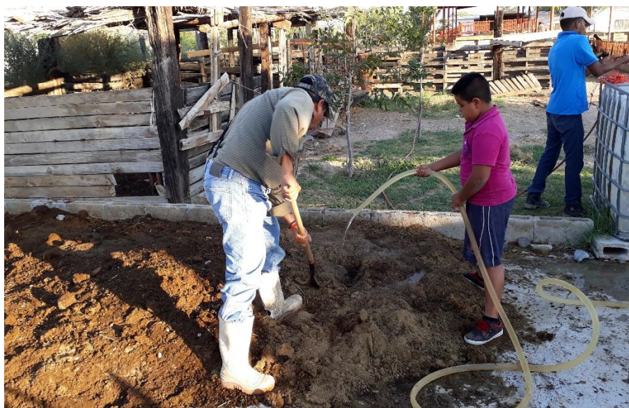
Fotografía 19. Preparación de caprinaza

La granja Don Laco contaba con dos camas de lombriz roja californiana, que se encontraba en total abandono y puesto que la caprinaza se dejaba en los corrales sin ningún fin específico y en temporada de lluvias estos presentaban encharcamiento total causando problemas en los animales. Por ello el productor procedió a sacar del aprisco este estiércol y dar tratamiento para ser brindado a la lombriz (fotografía 19), los resultados de este trabajo permitieron producir 12 toneladas de humus cada trimestre de excelente calidad, sin contar la cantidad de lombrices por metro cuadrado.