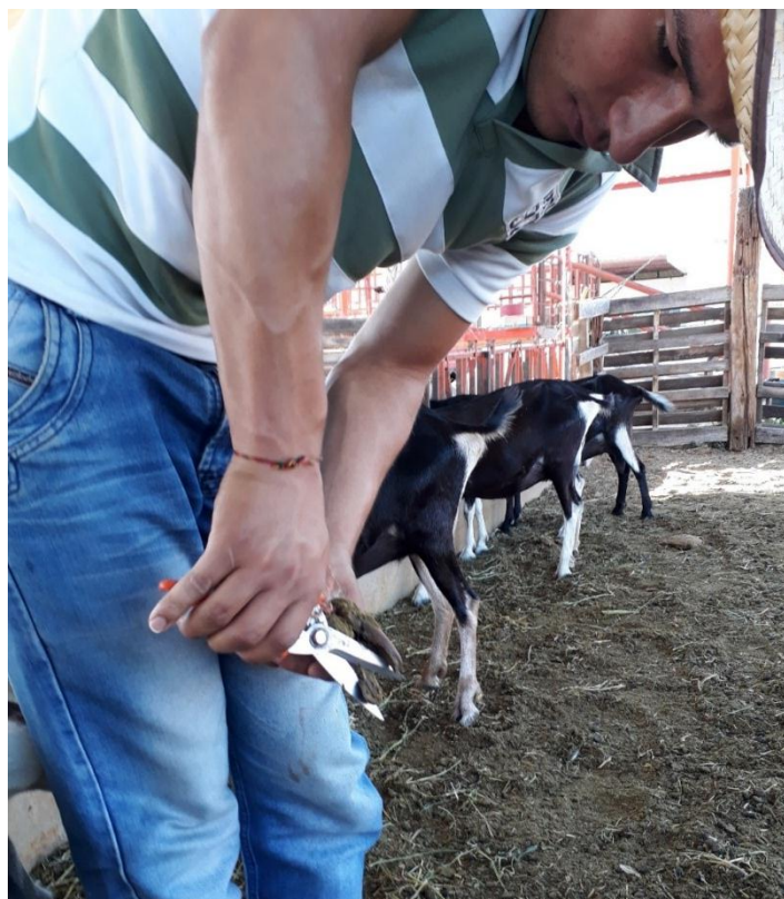
Fotografía 17. Despezúne

Las operaciones de manejo se realizan constantemente puesto que anteriormente no se estaba pendiente de algunas actividades como el despezúne, topización, entre otras. El productor tiene claro que realizando estas prácticas los animales estarán en condiciones de producir eficientemente. (fotografía 17).