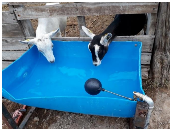
Fotografía 15. Nuevos bebederos

De igual manera se aclaró que la utilización de sales minerales es de gran aporte para el mejoramiento de la alimentación y que se debe tener a diario a su entera disposición (fotografía 16).