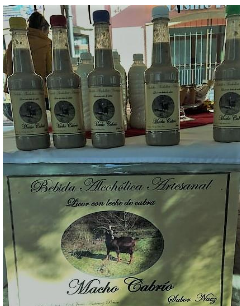
Fotografía 14. Bebida alcohólica artesanal

Otro derivado elaborado fue una bebida alcohólica, la cual tuvo venta rápida y generó un gran margen de ganancia del 58%. Estos productos se dieron a conocer en la feria del artesano cuyo escenario fue en la plaza mayor de la ciudad Lerdo Durango (fotografía 14).