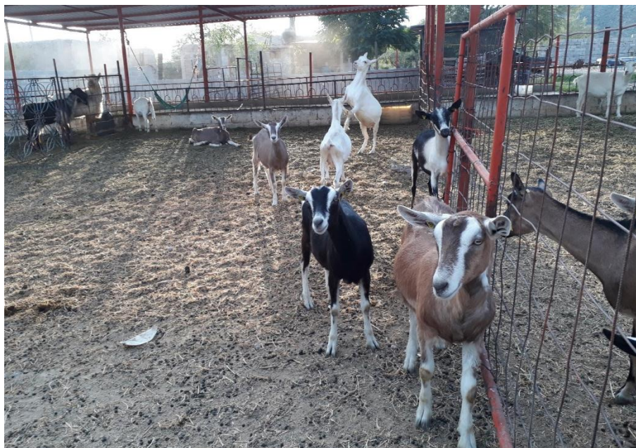
Fotografía 18. Corrales organizados por grupos