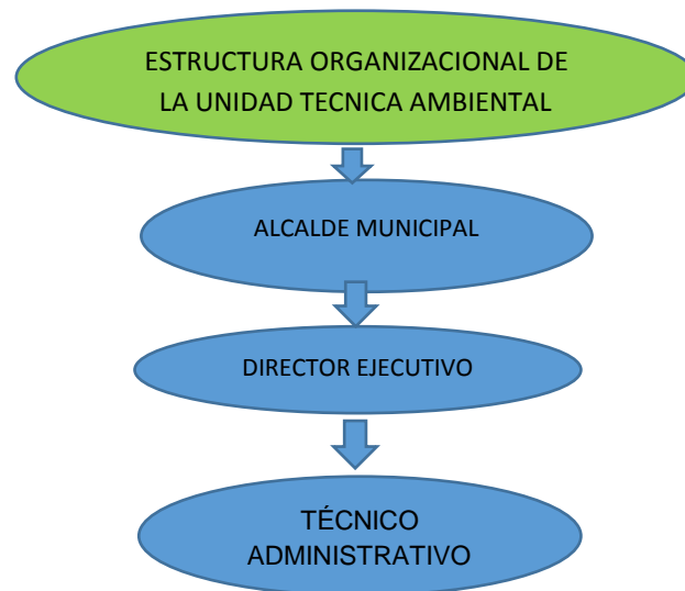
Figura 2. Organigrama general de la unidad técnica ambiental