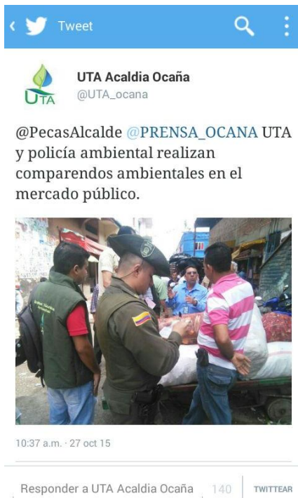
Imagen 3. Comparendos ambientales