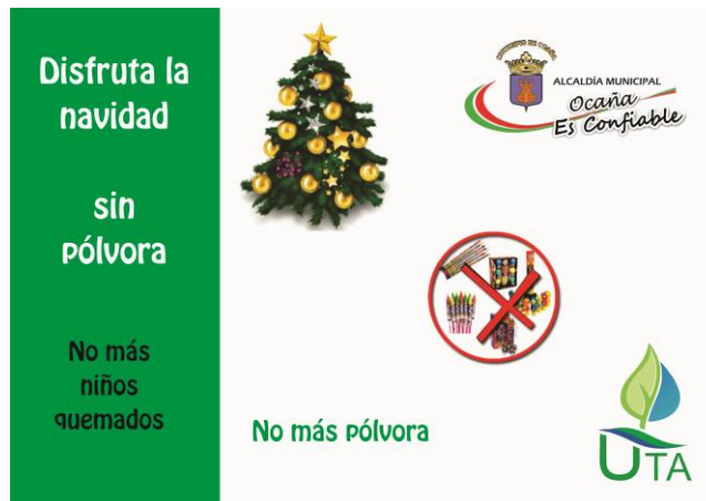
Imagen 5. Afiche sana convivencia