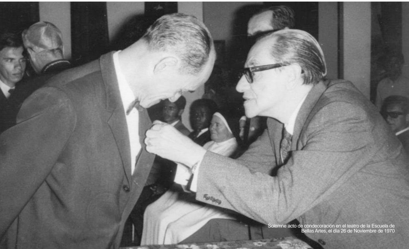
Solemne acto de condecoración en el teatro de la Escuela de Bellas Artes, el día 26 de Noviembre de 1970