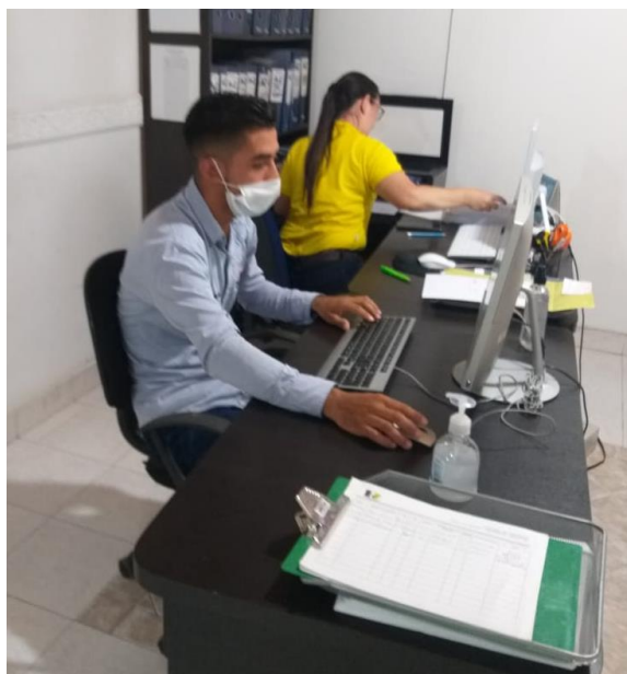
Figura 3. Digitalización de información contable

Durante todo el desarrollo de la pasantía se llevó el registro de las operaciones contables realizadas en la empresa, la cual permite organizar mejor la información respecto a los ingresos y egresos mensuales obtenidos, facilitando el trabajo del contador en la realización de los estados financieros.