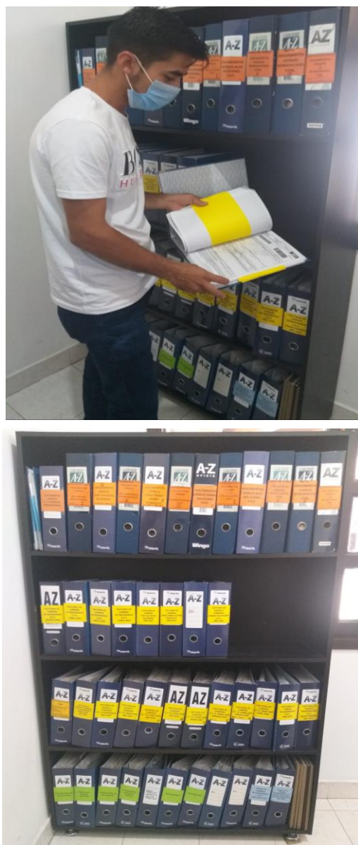
Figura 8. Organización archivo contable RE-INGENIERIA S.A.S.

En el área contable surgió la necesidad de crear una carpeta exclusivamente para cada transacción y operación realizada por la empresa como lo son: bancos, clientes, proveedores, obligaciones, DIAN, talento humano, entre otras.