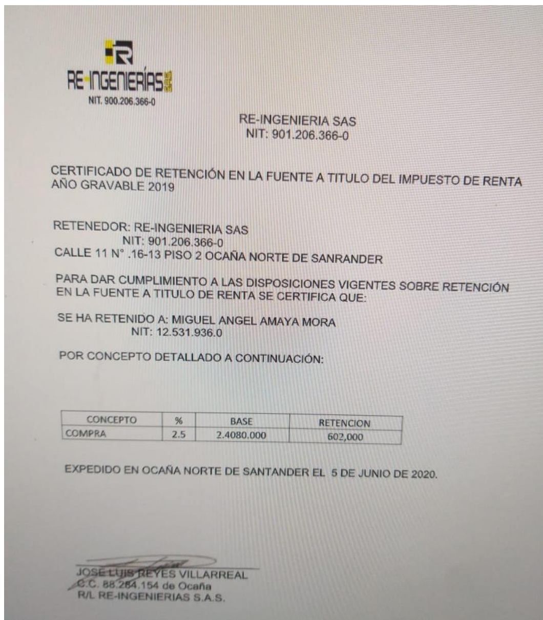
Figura 13. Certificados de retención en la fuente Fuente: Autoría propia, 2020

3.1.3.3. Evitar los desembolsos innecesarios en la constructora. Con esta estrategia se logró que la compañía generara exceso de capital en la compra de productos o pagos de servicios innecesarios para la empresa como tal, priorizando la compra de lo que más necesita, por ejemplo, relacionado a materia prima para la ejecución de los contratos adquiridos.