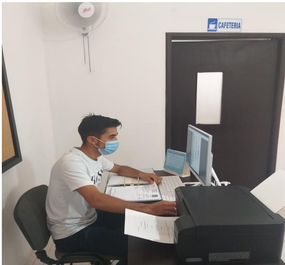
Figura 4. Facturación de servicios

importancia para los estudiantes de Contaduría pública, puesto que, se colocan aprueba todos los conocimientos adquiridos en la formación en estos temas relacionados con la parte tributaria de las empresas.