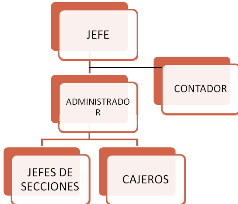
Figura 1. Estructura organizacional del Almacén La Provedora.