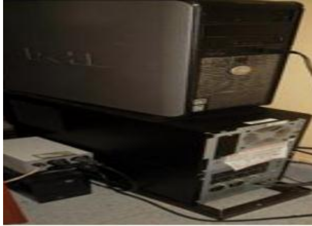
Figura 2. Equipo de cómputos de escritorio