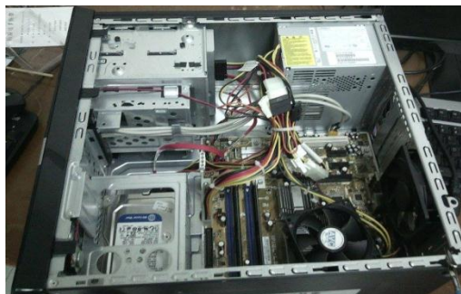
Figura 3. Revisión equipo de escritorio

Para realizar el mantenimiento preventivo y correctivo se contó con las herramientas adecuadas, por solicitud del jefe de sistemas se realizó mantenimiento preventivo de hardware y de software a todos los equipos de cómputo tanto a los portátiles como a los de escritorio y del mismo modo a las impresoras, como se puede evidenciar en las siguientes imágenes.