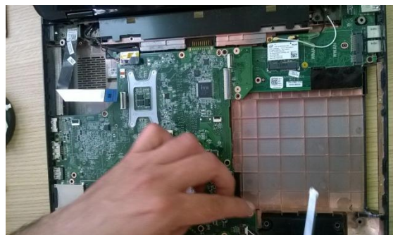
Figura 4. Portátil Dell inspiron N4110