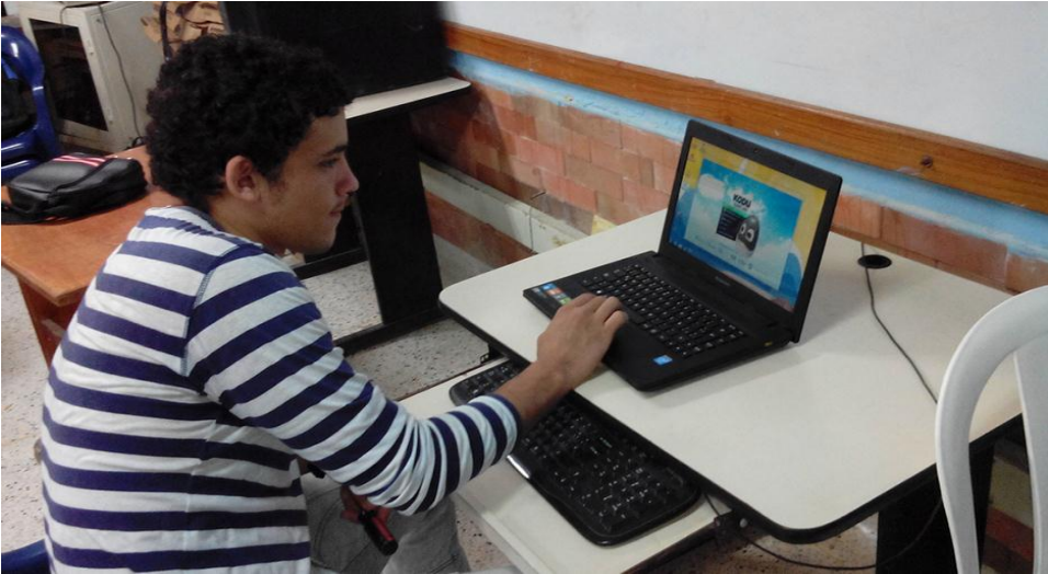
Figura 8. Instalación de sistemas operativos y softwares de aplicación