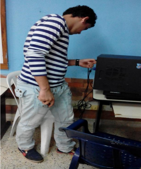
Figura 7. Instalación equipo con fuente de poder 500w