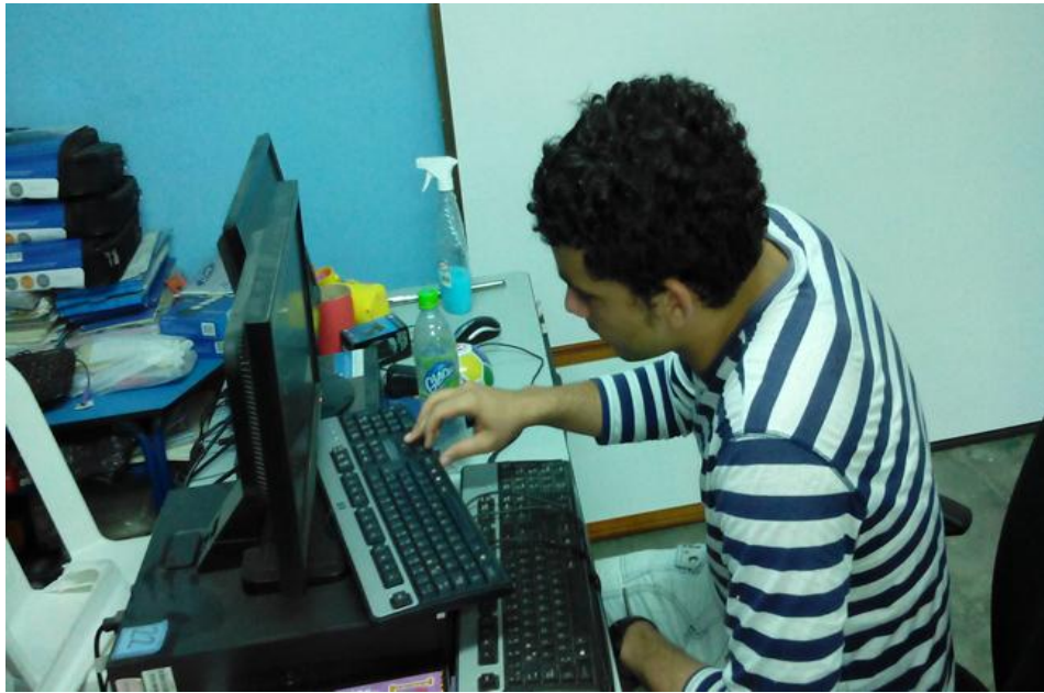
Figura 9. Actualización de software de aplicación