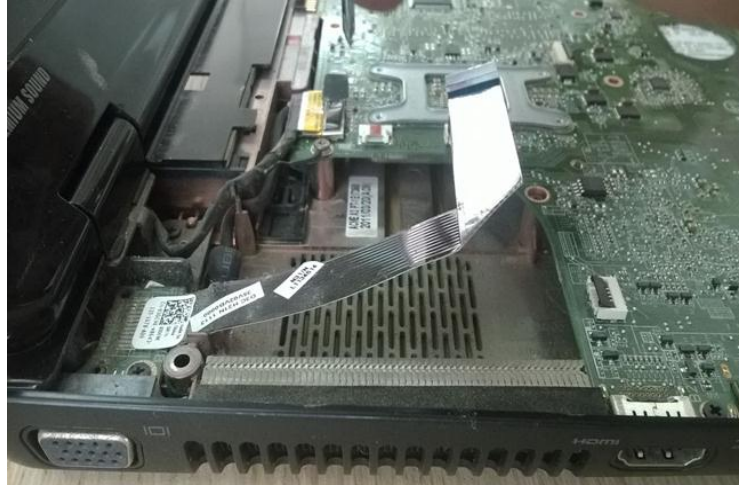
Figura 5. Localización ventilador Portátil Dell inspiron N4110