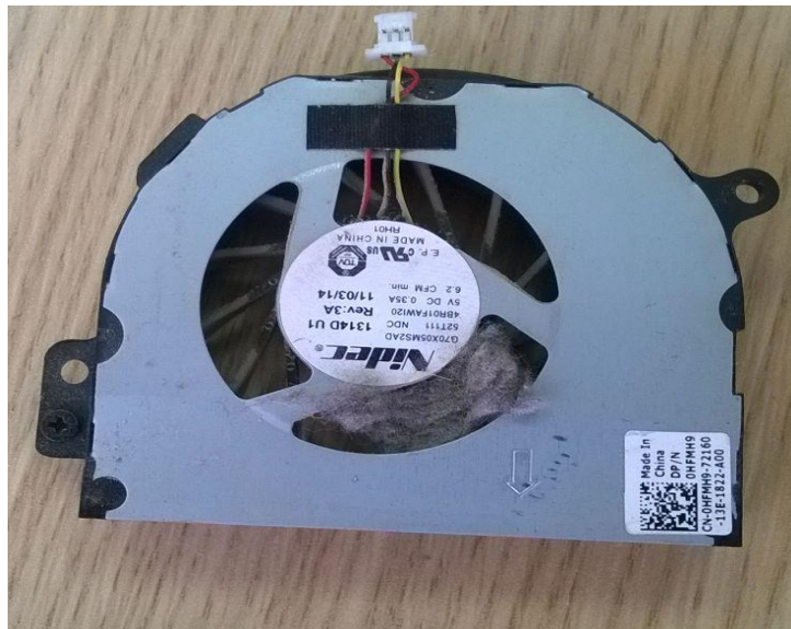
Figura 6. Ventilador del Portátil Dell Inspiron N4110