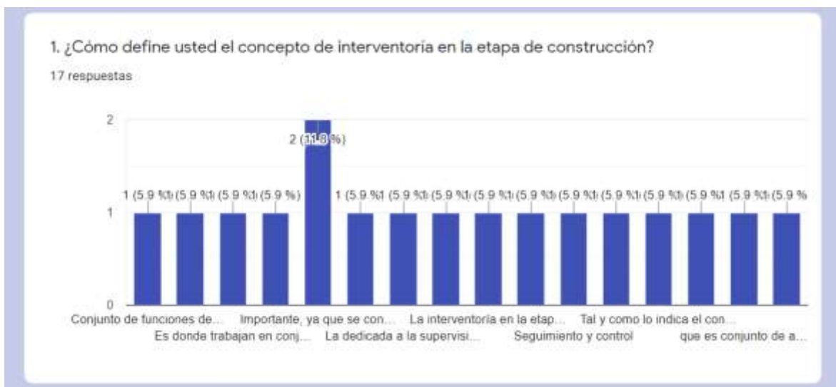
Figura 1. Definición del concepto de interventoría en la etapa de construcción.

Se observa que el concepto más importante sobre interventoría se da a partir de su función intermediario entre la entidad contractual y el contratista en la ejecución y control de las actividades que se realicen en el desarrollo de la obra.