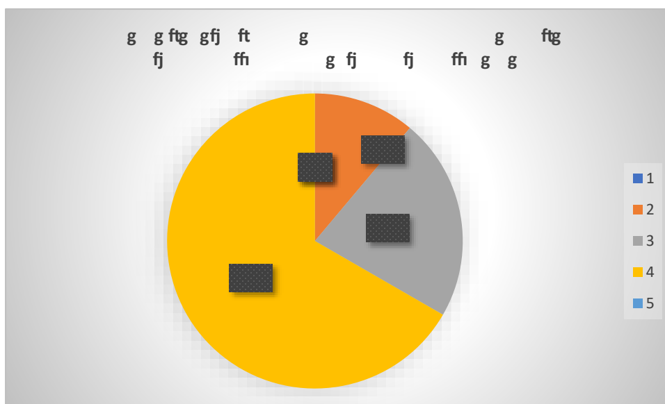
Figura 1. Pregunta 1.

Teniendo en cuenta los resultados de las encuestas y desde lo que exponen los entes de control y vigilancia en este caso la DIAN se obtiene que: