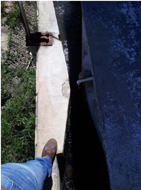
Foto 3. Canaleta parshall

Almacenamiento y reparto. El agua es conducida mediante canaleta parshall hasta la estructura donde se realiza el floculado, con medidas de 7m de largo, 3,5 de ancho y 1m profundidad luego pasa a un sedimentador y posteriormente a unos filtros interconectados que llevan el agua a un tanque de cloración para finalmente ser distribuida mediante tubería de 12” de diámetro con conforma la red de acueducto municipal para luego ser distribuida a las viviendas de la población.