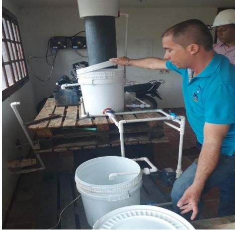
Foto 13. Dosificador no convencional

Dosificadores. Cuenta con un sistema elaborado empíricamente con tubería pvc y baldes plásticos.