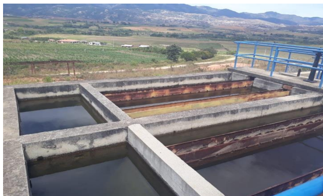
Foto 16. Sedimentadores