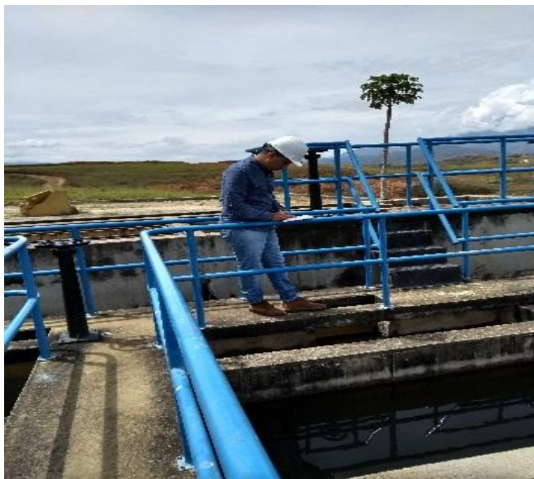
Foto 1. Visita PTAP Santa Lucia

Para las dos plantas se llevó acabo un mismo recorrido donde se revisó la funcionalidad de cada unidad de tratamiento y la infraestructura física con la que cuenta actualmente la planta.