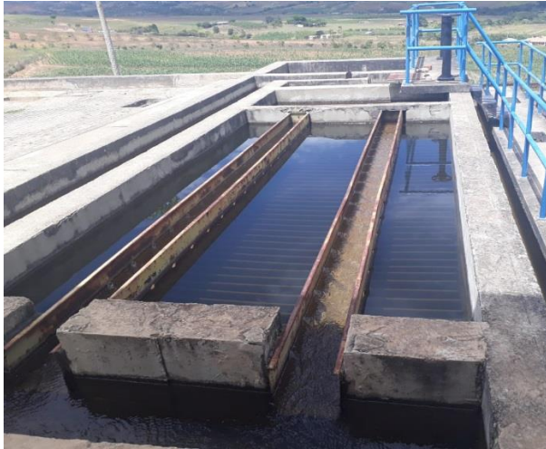
Foto 11. Desarenador

cruda captada, es transportada por tubería de PVC de 10” en una longitud de 4050m reducida a tubería de PVC de 8” en una longitud de 5940m hasta la planta de tratamiento para un total de 9990m de distancia.