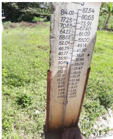
Foto 5. Regleta de medición de caudal

Medición del caudal. La medición del caudal se realiza en canaleta Parshall, por lectura visual utilizando una regleta. Para el día de la visita se registró un caudal de agua captada de 32,96 l/s.