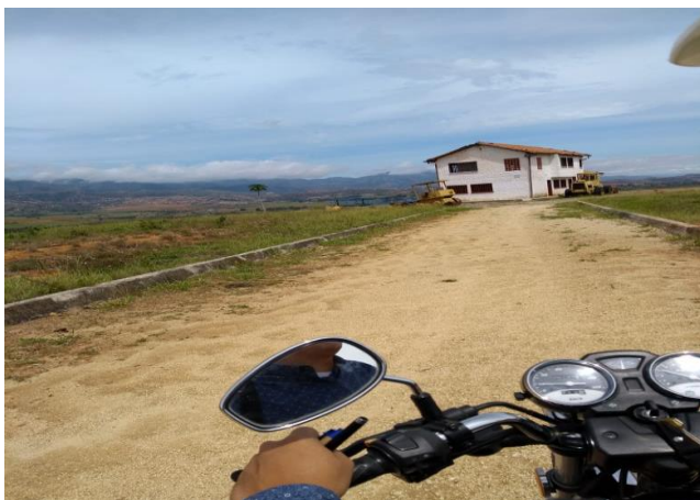
Foto 12. Planta de tratamiento Santa Lucia

Planta de Tratamiento. Estructuras de tipo convencional; ocupa un área de 17.40m x 11.15m. Además, cuenta con un edificio de operación.