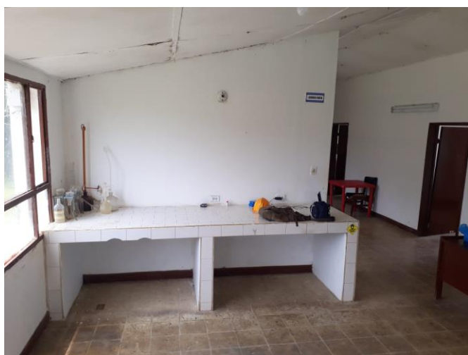
Foto 10. Área de laboratorio

Laboratorio. No se encuentra en funcionamiento. En el caso de necesitar análisis bacteriológicos se solicita al instituto departamental de salud unas muestras periódicas cada 15 días.