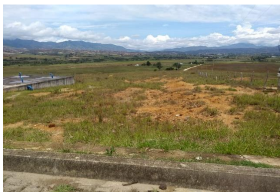
Foto 19. Tanques de almacenamiento

Almacenamiento. Se realiza en un tanque semienterrado con una capacidad de 1000m 3 allí se adiciona el cloro líquido para eliminar los microorganismos indeseables y permitir que el agua sea apta para consumo humano. Se utiliza una dosificación promedio de 2.0 mg/L.