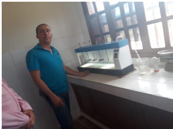
Foto 18. Laboratorio

Laboratorio. El cual no se encuentra en funcionamiento pero tiene los elementos básicos para colocarlo a funcionar y solo realizan la prueba de jarras. En el caso de necesitar análisis bacteriológicos se envían al laboratorio de Cúcuta cada 22 días con observaciones que puntualizan ausencia de cloro.