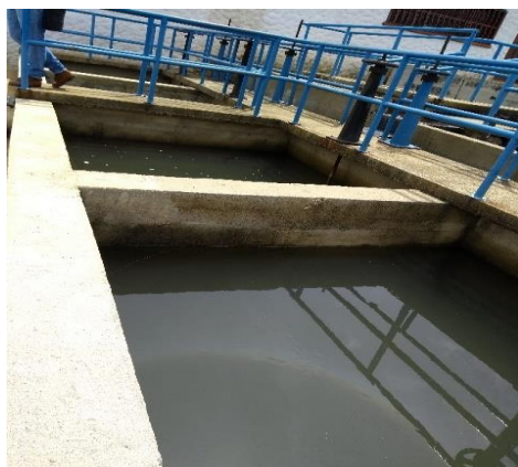
Foto 17. Filtros

Filtración. El agua llega por el canal de interconexión a los 3 filtros el cual presenta 3 compuertas de admisión y desagüe. El filtro debe ser lavado correctamente y está conformado 31 de la siguiente manera. Arena, grava, antracita. En la plata se realiza el lavado diario de los filtros cerrando las compuertas de admisión y abriendo las compuertas de desagüe; el agua almacenada tratada se devuelve a los tanques de filtración a presión lo cual permite expansionar el lecho filtrante liberando las partículas de suciedad retenidas (RETROLAVADO). Teniendo una perdida diaria de 300 m 3 por los tres filtros.