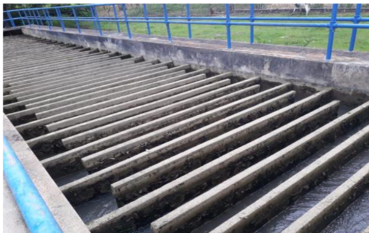
Foto 7. Floculadores

Floculación. De flujo horizontal provisto de una serie de tabiques en concreto a través de los cuales el agua hace un recorrido de ida y vuelta, con un tiempo de retención de 15-18 minutos para poder hacer la reacción química y se produzca la floculación; consiste en que las partículas se aglomeren y formen el floc.