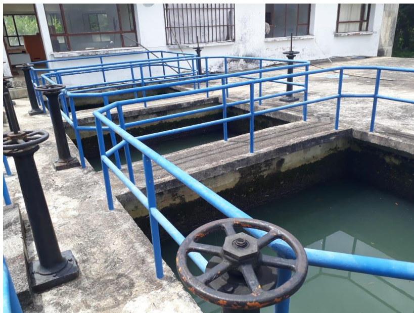
Foto 9. Filtros