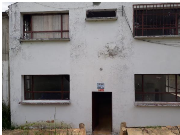
Foto 4. Edificio de planta