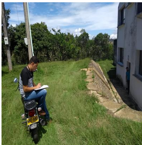
Figura 21. Aplicando formulario de IRABA a la planta de Santa Lucia Fuente. Pasante