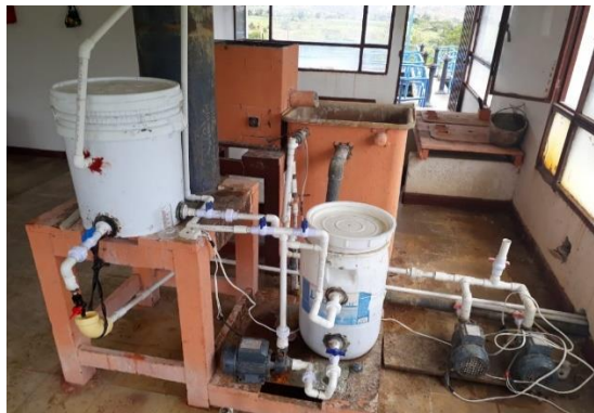
Foto 6. Dosificador no convencional

Dosificación de coagulante. El coagulante utilizado con mayor frecuencia es clarifloc n° 28 floculante líquido. El coagulante lo dispersan uniformemente en el agua con la máxima rapidez que pueda alcanzar a fin de asegurar que el proceso de coagulación sea eficaz.