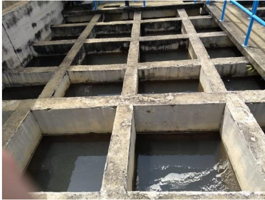
Foto 15. Floculadores

Floculación. Consiste en que las partículas se aglomeren y formen el floc. Este tanque en concreto presenta las siguientes dimensiones 17m de longitud x 3m de ancho x 1m profundidad; de flujo horizontal provisto de una serie de tabiques en concreto atreves de los cuales el agua hace un recorrido de ida y vuelta, con un recorrido estipulado de 15 minutos para poder hacer la reacción química y se produzca la floculación.