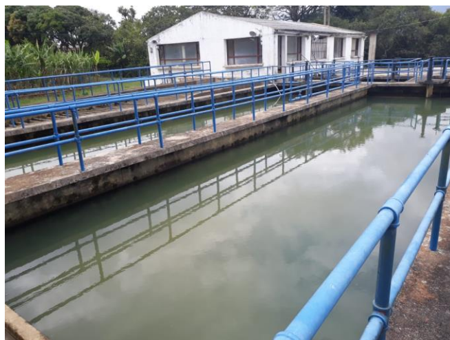
Foto 8. Sedimentadores

Sedimentación. La planta cuenta con dos tanques sedimentadores, por los dos costados generando el paso continuo de manera que la velocidad del agua sea igual en todos los puntos 34 de los tanques de sedimentación a los diferentes filtros permitiendo así la separación del floc que se ha formado en el agua por acción de la gravedad.