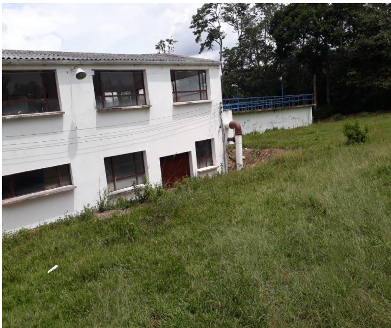
Foto 2. Visita PTAP casa de teja