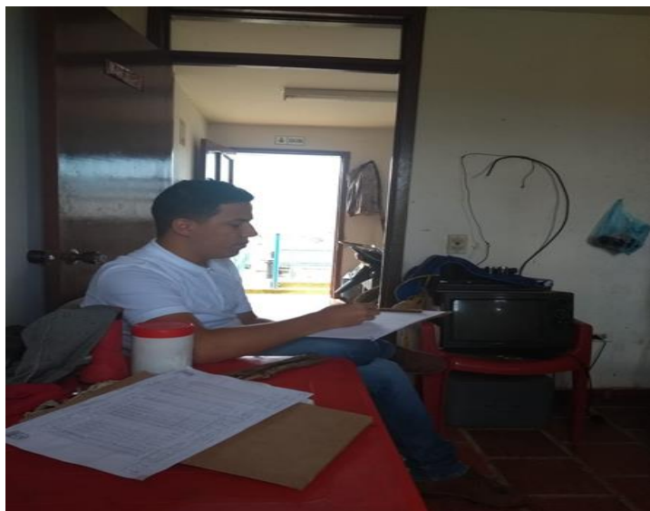
Foto 20. Aplicando formulario de IRABA a la planta de Santa Lucia Fuente. Pasante

En el formulario también aplica una calificación para la persona prestadora por buenas practicas sanitarias – BPS, donde se suman los valores de las columnas P (parcialmente) y NO que se anotaran al final.