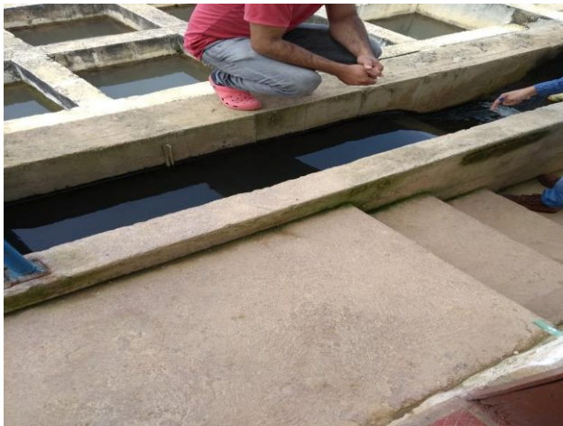
Foto 14. Indicando mezcla rápida

Mezcla Rápida. Consiste en dispersar el coagulante uniformemente en el agua con la máxima rapidez que pueda alcanzar a fin de asegurar que el proceso de coagulación sea eficaz.