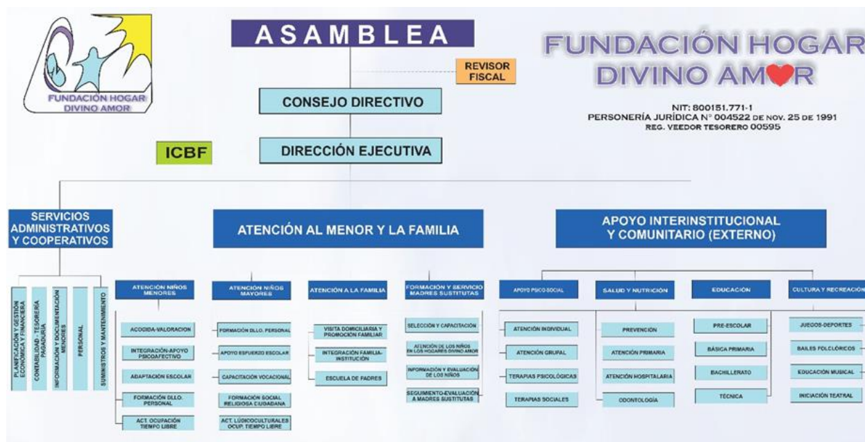
Figura 1. Organigrama tomado del manual de ética de la Fundación Divino Amor