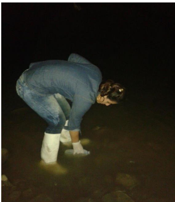
Fotografía 9. Tomas de muestras Aguas Residuales (Aguas arriba)