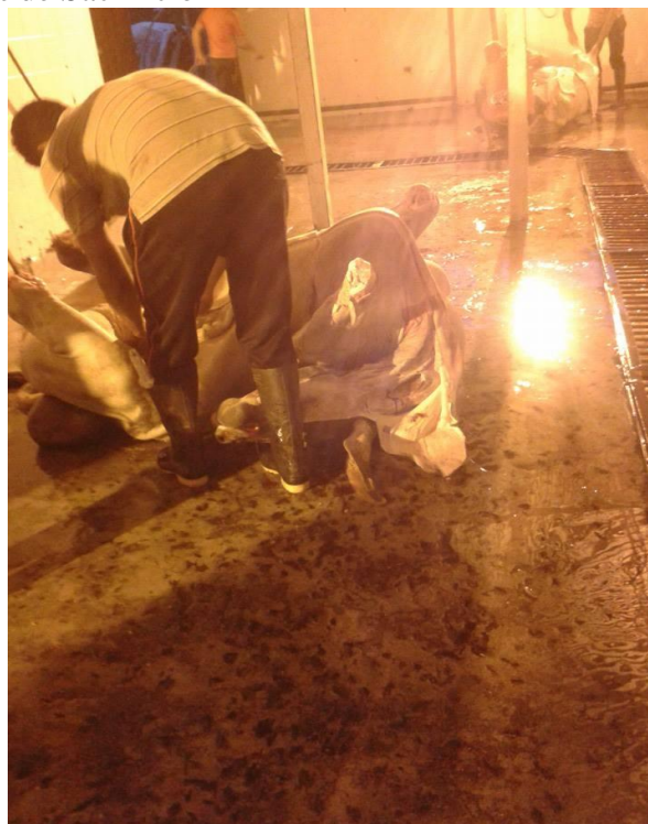
Fotografía 6. Procesos de Sacrificio