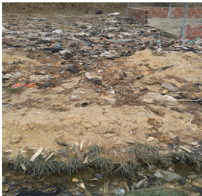
Fotografía 5. Residuos Sólidos en la Planta de Beneficio