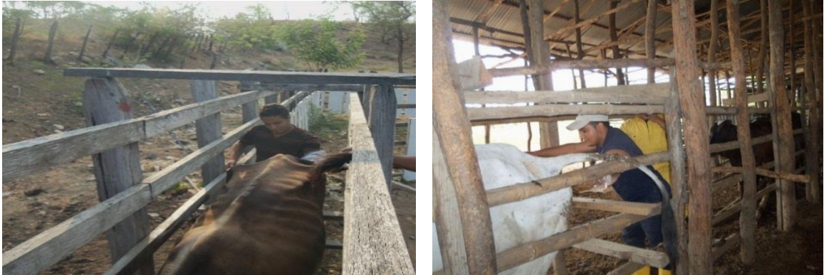
Imagen 4. Palpación.