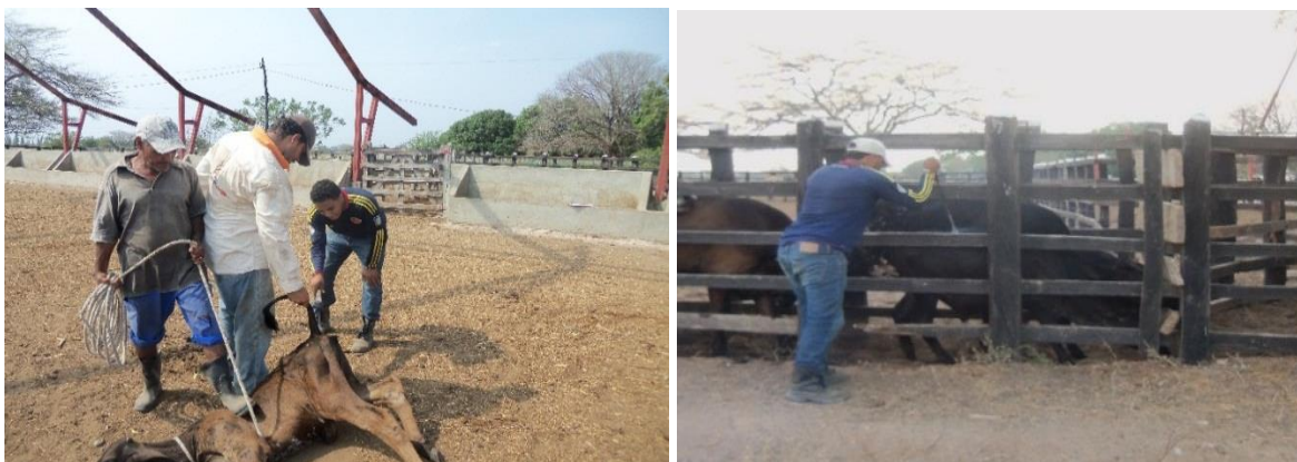
Imagen 3. Numeración de animales.

práctica, por ejemplo una vaca que pario en el año 2014, del mes de marzo, el día 23; le corresponde la numeración 14223.