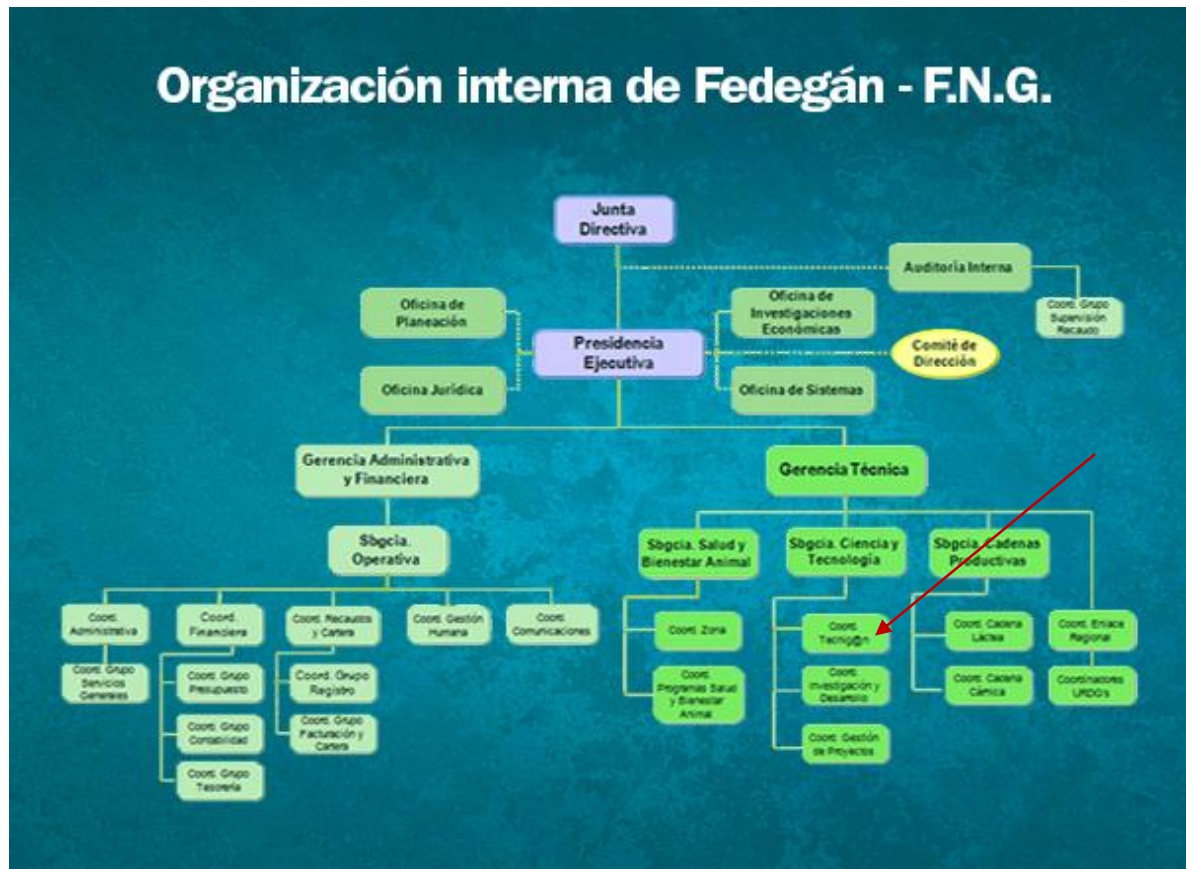
Figura 1. Organigrama de FEDEGAN.

1.1.5 Descripción de la dependencia y/o proyecto al que fue asignado. El Centro de servicio tecnológico ganadero 'TECNIG@N' es operado dentro de las instalaciones del comité de ganaderos de Riohacha "COGARÍ" en el municipio de Riohacha - La Guajira, en la Calle 21 No. 13 – 59, pero cubre todo el departamento de la guajira.