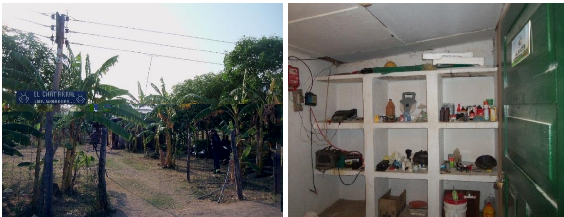
Imagen 7. Señalización de áreas.

3.1.10 Establecimiento de BPG: se les enfoca a los ganaderos sobre los protocolos de las buenas prácticas ganaderas (BPG) como son: capacitación a los trabajadores y a los propietarios de las empresas ganaderas en cuanto al llenado de registros, elaboración de ensilajes, preparación de bloques multinutricionales, sistemas de numeración; señalización de todas las áreas de la finca como numeración de potreros, bodega, corrales, zona social; manejo de residuos sólidos como hojas, empaques de plásticos o empaques de productos agropecuarios, guantes de palpar; limpieza de bebederos que se deben realizar cada 3 días; no maltratar ni gritar a los animales para mejorar su bienestar animal y optimizar sus producciones.