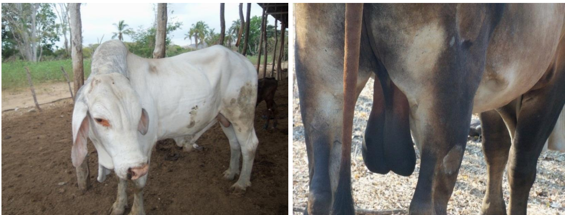
Imagen 5. Análisis de los reproductores.

3.1.8 Análisis de reproductores: se observaron algunos reproductores donde algunos no tienen las características fenotípicas y poseen anomalías como la circunferencia escrotal no está acorde con la edad, albinismo, mala proporción cárnica, longitud corta, poca profundidad en las costillas, etc. Por lo tanto se le recomendó el cambio del reproductor ya que se estaba transmitiendo sus características a sus descendientes.