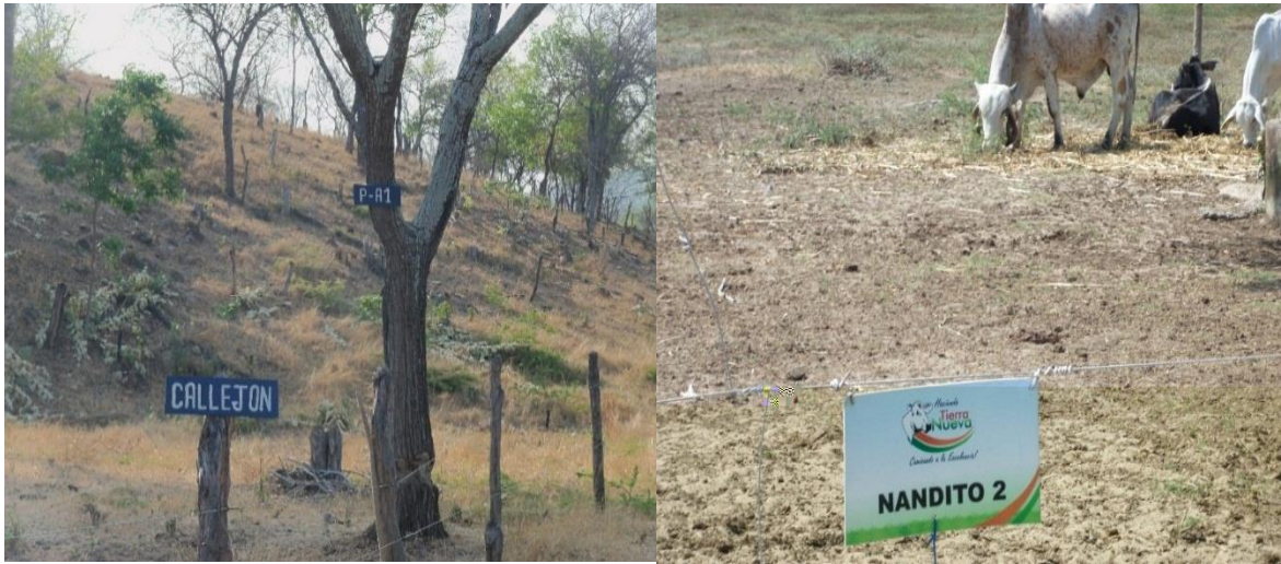
Imagen 6. División de potreros.