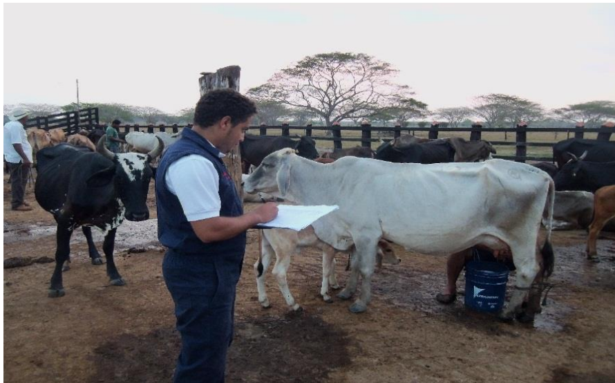
Imagen 1. Llenado de registro.