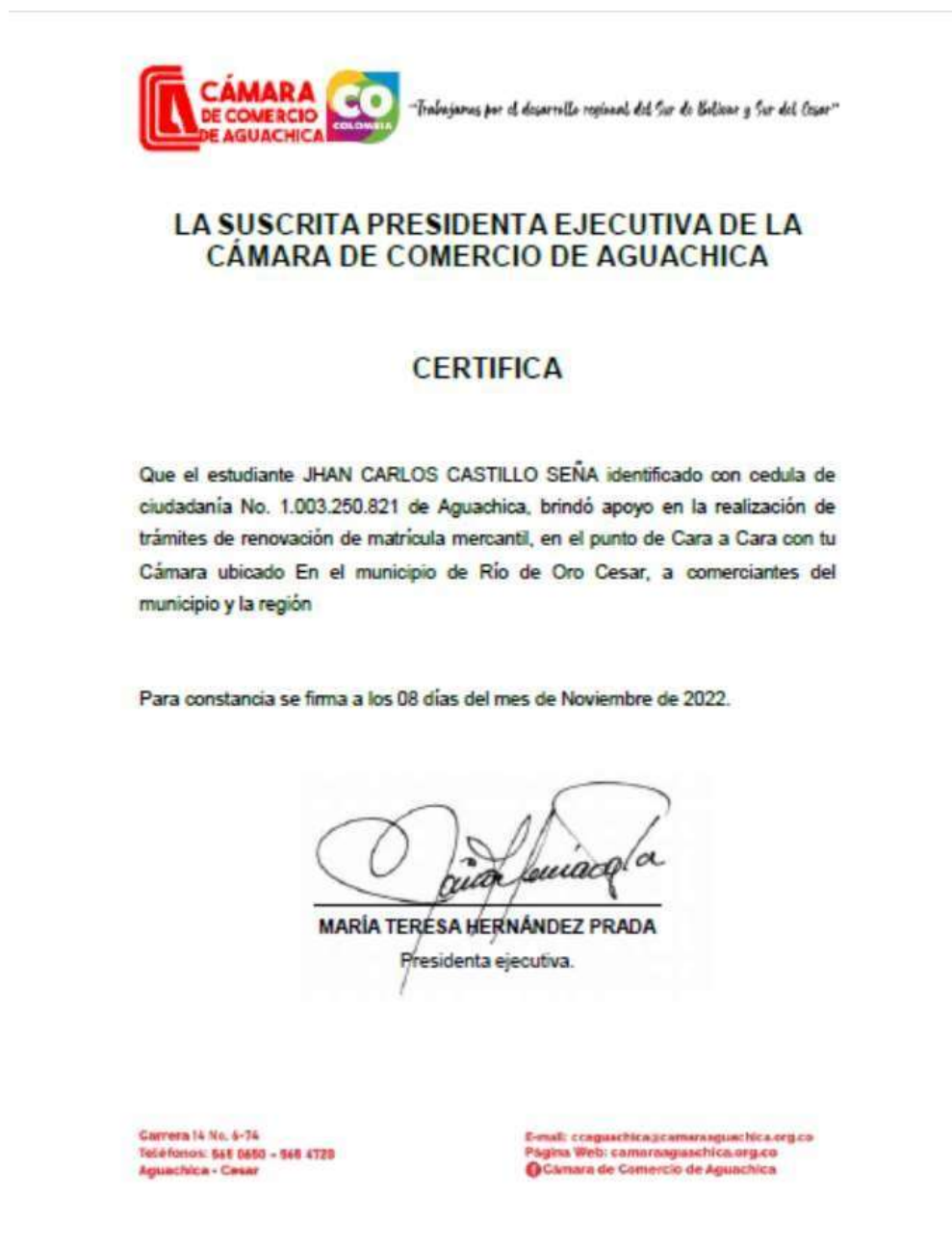
Figura 5 Certificación prestación del servicio de renovaciones.

Nota. Certificado de acompañamiento en actividades de renovación de matrícula mercantil entregado por la (Cámara de Comercio de Aguachica, 2022).