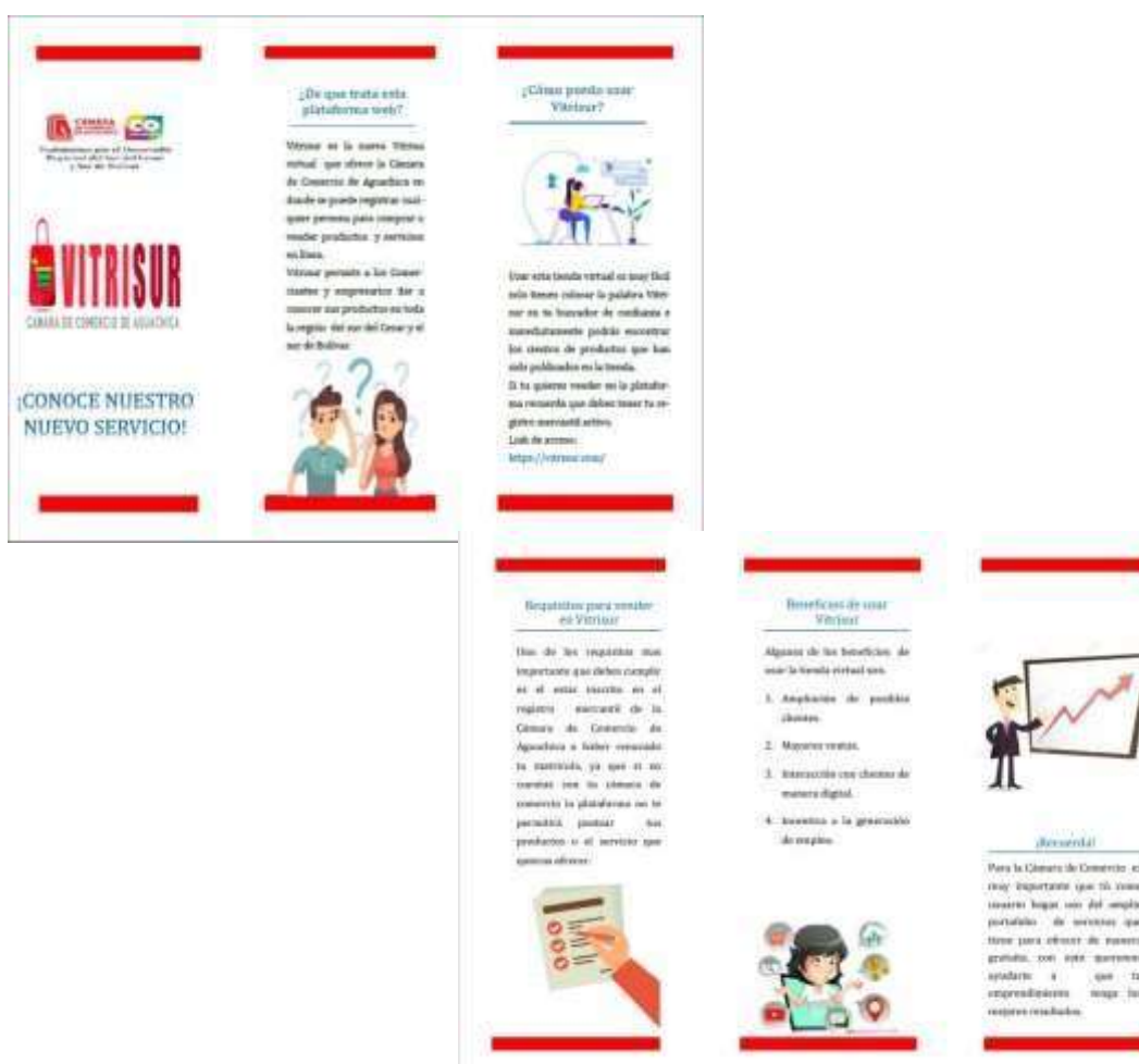
Figura 13 Folleto para ofertar la tienda virtual Vitrisur

Para el desarrollo de esta actividad se diseñó un folleto el cual suministra información acerca de la tienda virtual de la Cámara de Comercio de Aguachica, mostrando los beneficios de una forma sencilla y directa, señalando los requisitos para poder hacer uso de este portal web. (Véase en figura 13)