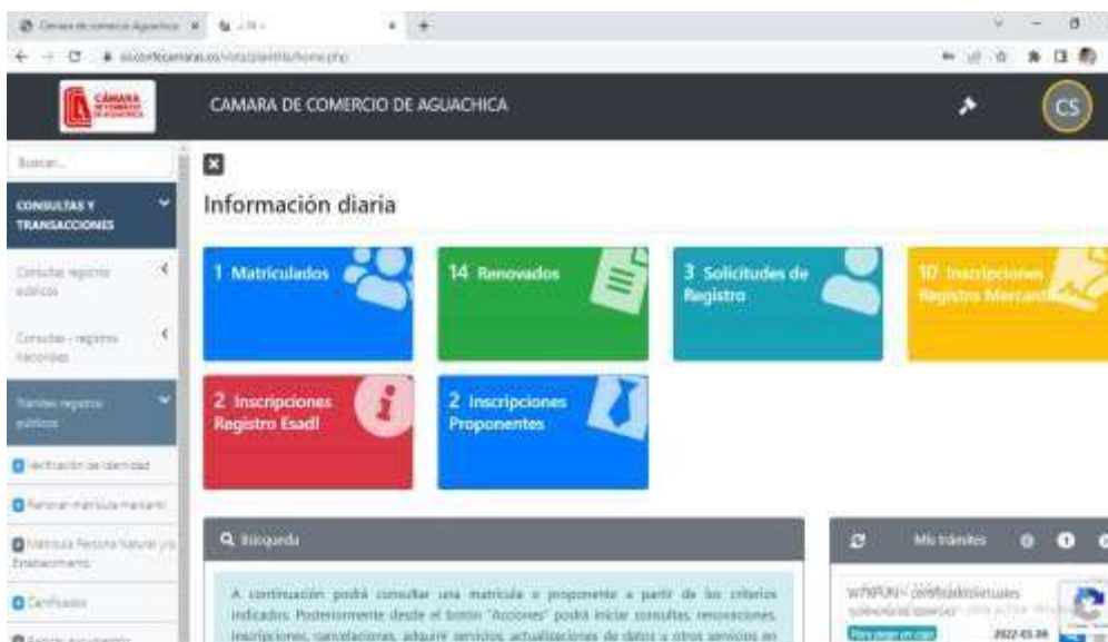
Figura 11 Portal SII Aguachica

Nota. Plataforma para la realización de trámites y radicación de documentos. (Confecámaras, 2021)