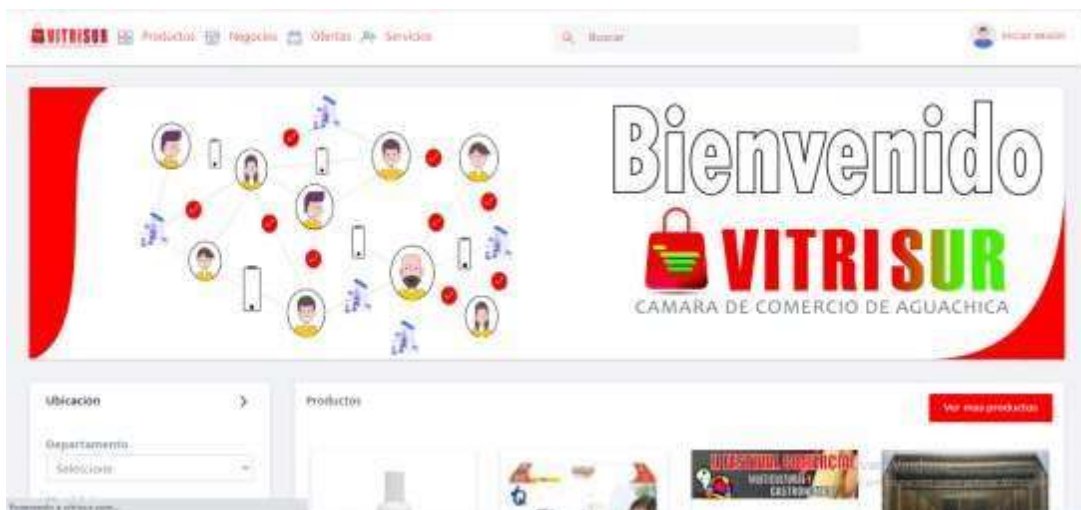
Figura 10 Portal Web Vitrisur

Nota. Tienda virtual para vender en línea (VITRISUR, 2021).