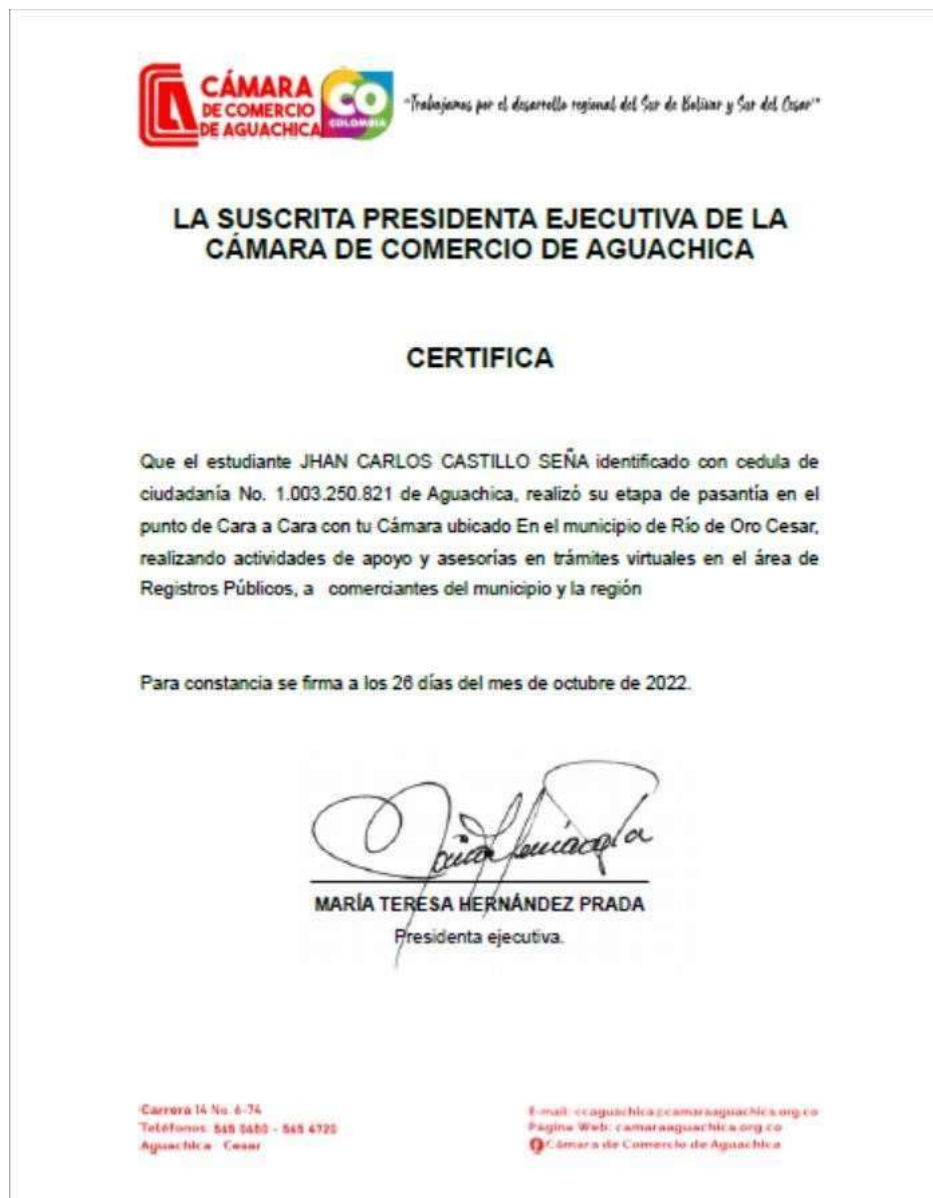
Figura 17 Certificado de Acompañamiento a la Cámara de Comercio de Aguachica

Nota. Certificado de realización de actividades entregado por la (Cámara de Comercio de Aguachica, 2022)