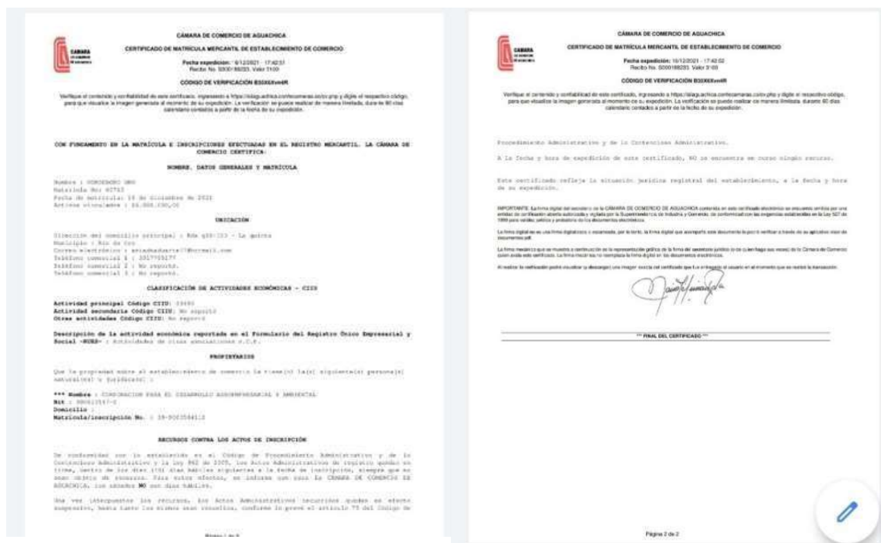
Figura 6 Certificados mercantiles y de existencia y representación legal

Nota. Certificados generados por la (Cámara de Comercio de Aguachica, 2021)