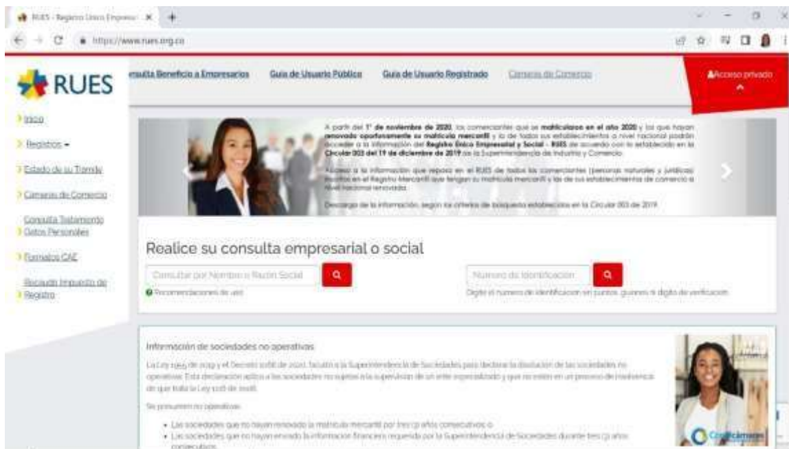
Figura 16 Plataforma RUES

Nota. Plataforma donde se verifica el nombre del establecimiento (RUES, 2021)