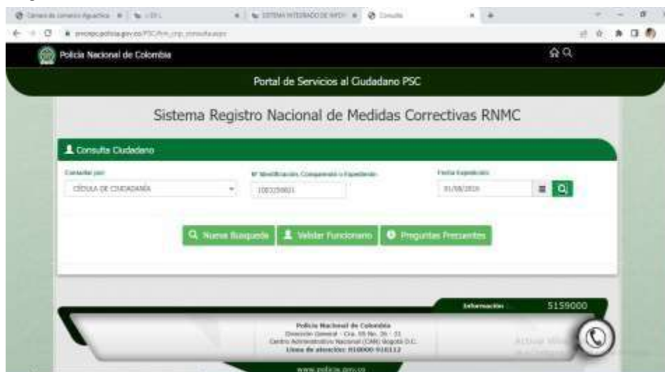
Figura 15 Página de Policía nacional

Nota. Portal web de la Policía Nacional para revisar que el usuario no tuviera ningún requerimiento policial. (Policía Nacional, 2021).