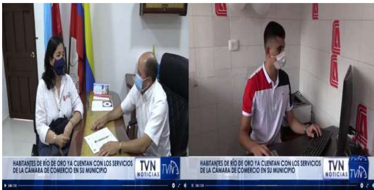
Figura 8 Inauguración y promoción del punto de Cámara de Comercio en Rio de Oro

Nota. Firma del convenio de apertura de la Cámara de Comercio de Aguachica en el municipio de Rio de Oro transmitido en (Provincia Tv de TVNorte, 2021).