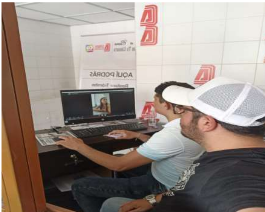
Figura 14 Reunión entre usuario y asesora de la Cámara de Comercio