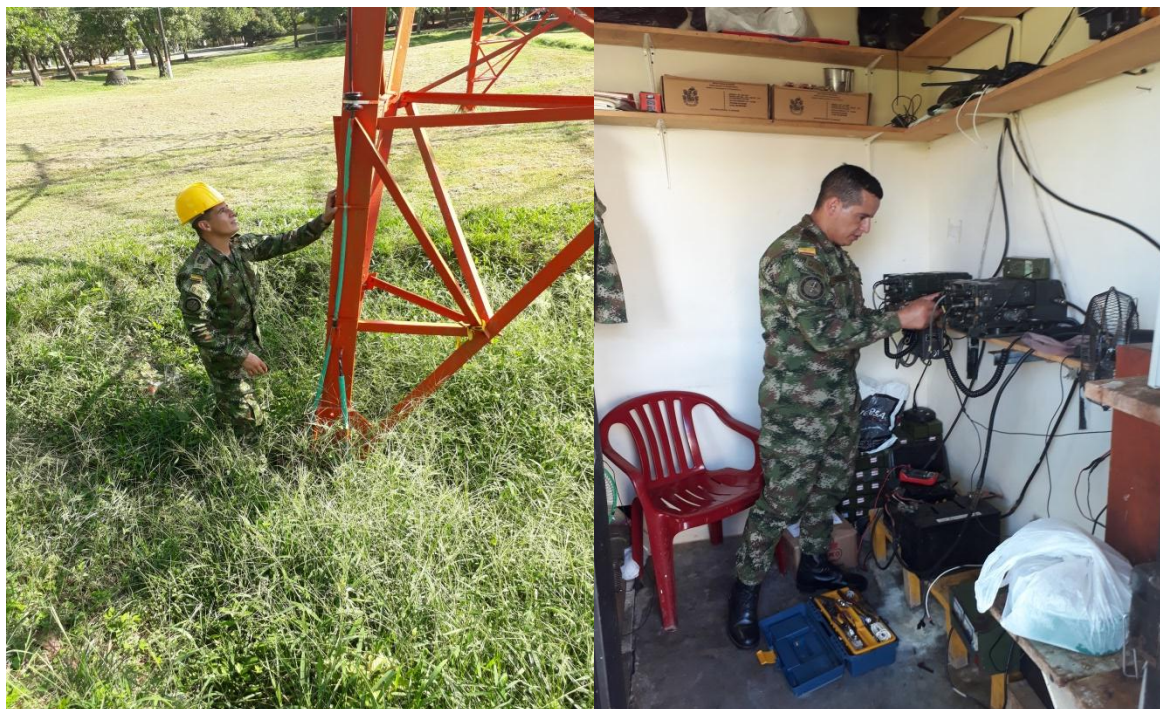
Verificacion, recuperacion y mantenimiento equipos de computo bodegas brigada movil No 25